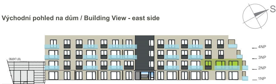
Východní pohled na dům / Building View - east side